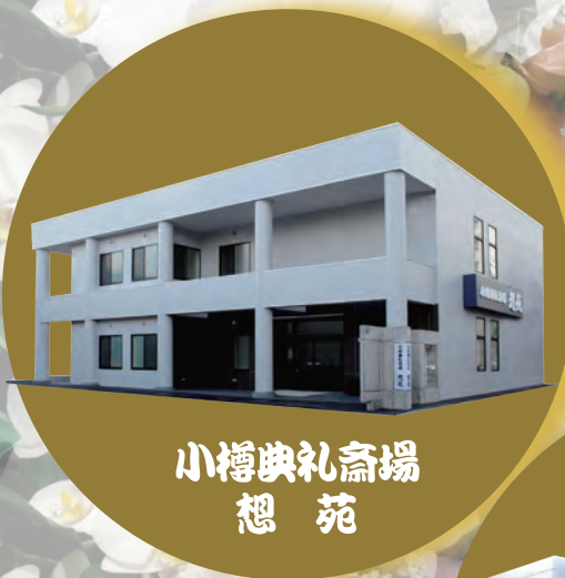
小樽典礼斎場 想苑