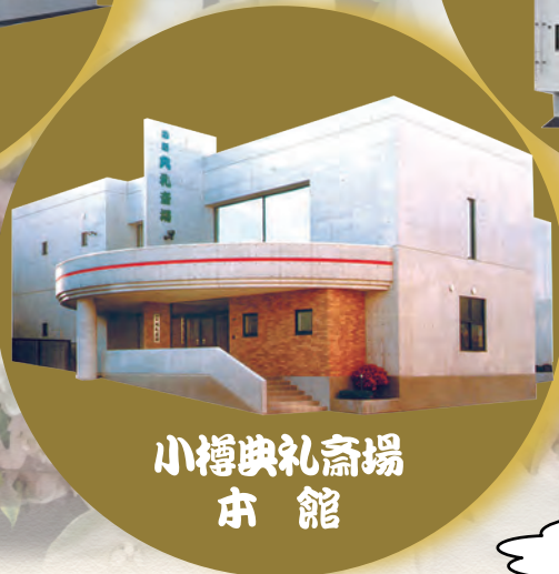
小樽典礼斎場 本館