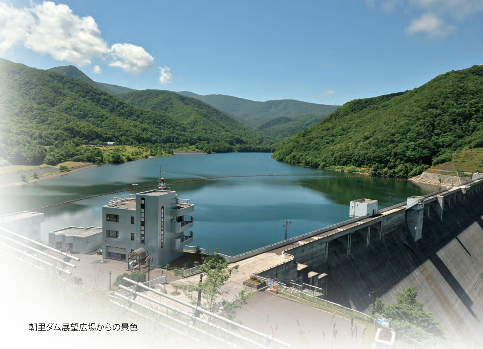
朝里ダム展望広場からの景色