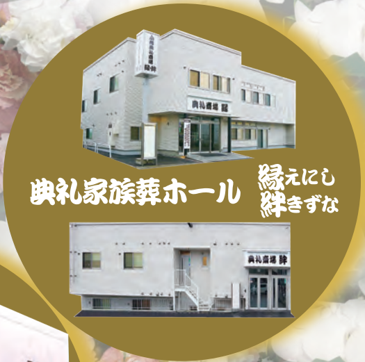
典礼家族葬ホール 縁 元にし 絆 きずな