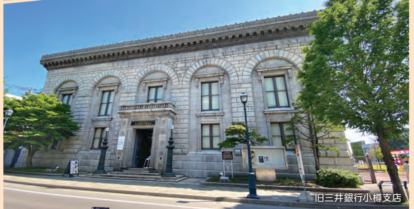
旧三井銀行小樽支店