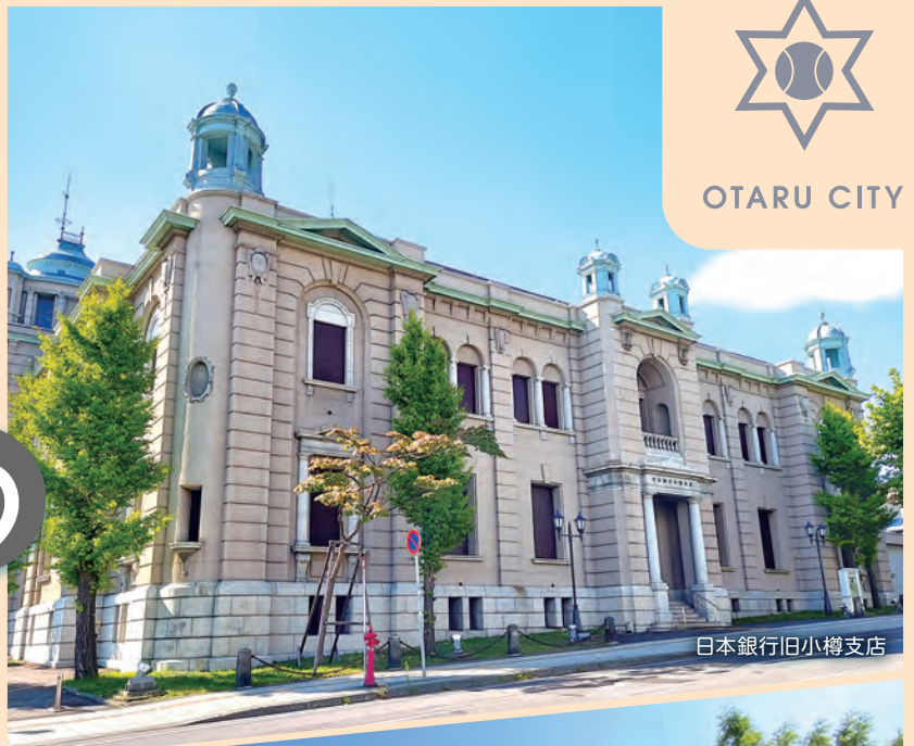
日本銀行旧小樽支店