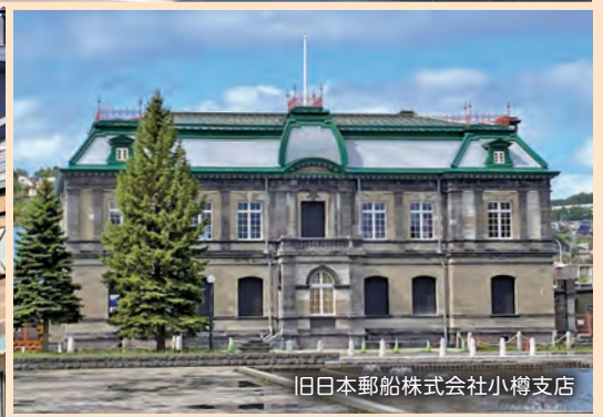
旧日本郵船株式会社小樽支店