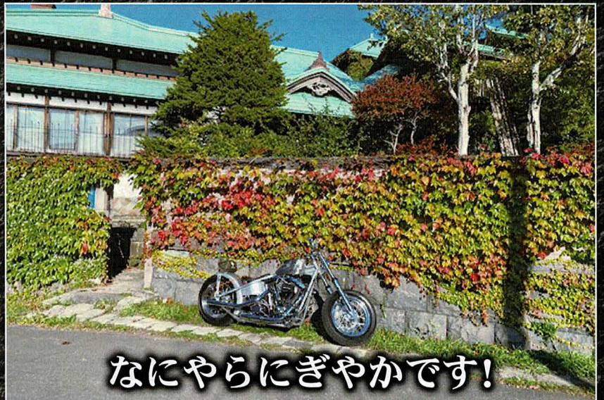
なにやらにぎやかです!