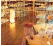
五颜六色的玻璃制品