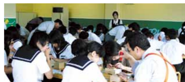
选择喜欢的曲子和零件,制作自己的 八音盒吧。也可以团体参加。