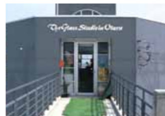
The Glass Studio in 小樽