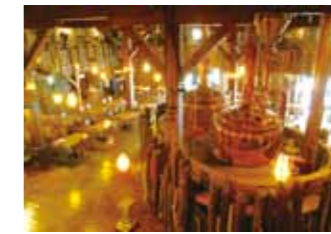
小樽啤酒(小樽仓库 No.1)