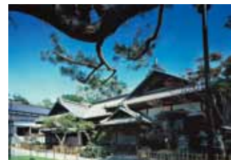
小樽贵宾馆(旧青山别邸)