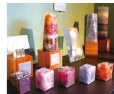
尝试制作您自己的原创蜡 烛吗? 所需时间为15~30 分钟左右。