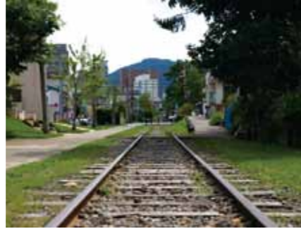
旧国有铁路手宫线