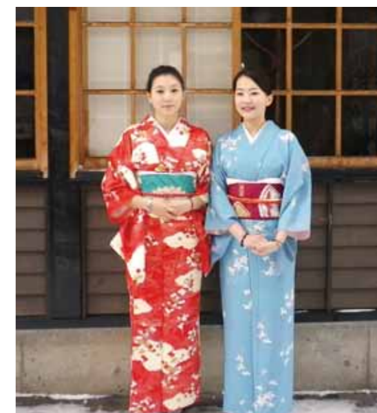
穿上威尼斯礼服和狂欢节服 装拍张纪念照怎么样? 穿着出 租的和服在市街散步也是很 受欢迎的旅游项目。