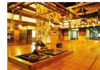
余市町·旧下余市运上家