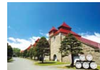
余市町·NIKKA 威士忌北海道工场余市蒸馏所