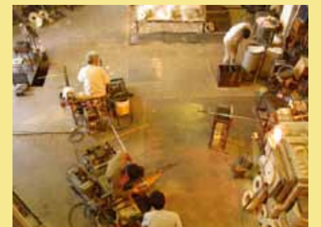
The Glass Studio in 小樽