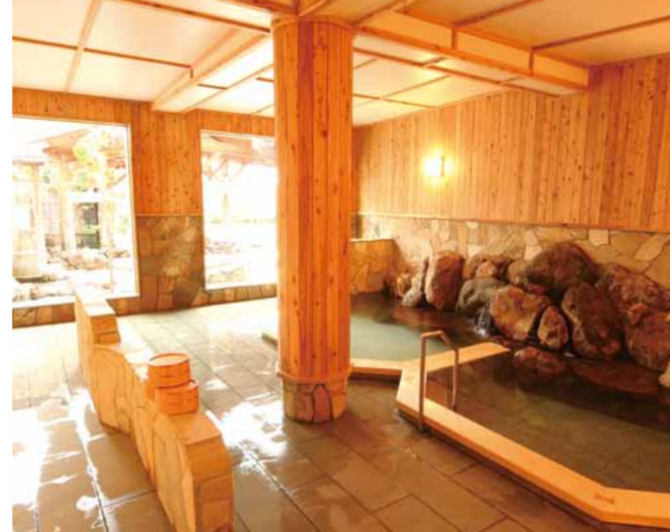
只有温泉之地才可以享受到四季自然的露天温泉。