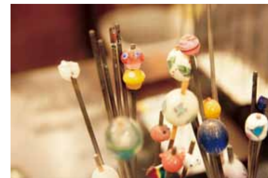
作为旅行的纪念,制作美丽的“蜻蜓玉石” (玻璃球)手制饰品。

通过体验产品制造来拓展您的新世界吧。在小樽可以享受玻璃工艺、蜡烛、八音盒、陶瓷工艺等各种各样的产品制造体验。