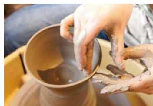
通过陶瓷工艺体验制作日常 使用的容器。每次使用时都 会勾起旅行的回忆。