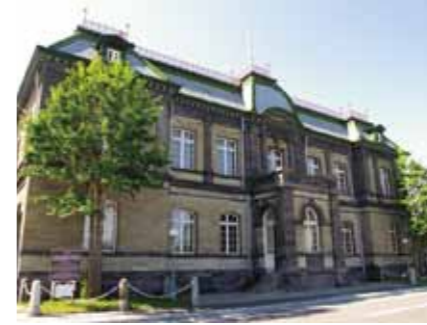
旧日本邮船（株）小樽支店