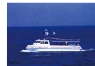
积丹町·海上散步(新积丹号)