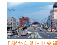
↑駅から見た中央通り