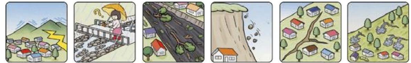
山鳴りがする 雨が降り続いて川の水位が下がる 川の流が濁り流木が混ざりはじめる 小石がパラパラ落ちてくる 地面にひび割れができる 斜面から水がふき出す

次のような現象を察知した場合は、土砂災害が直後に起こる可能性があります。直ちに周りの人と安全な場所へ避難するとともに、関係機関へ通報して下さい。