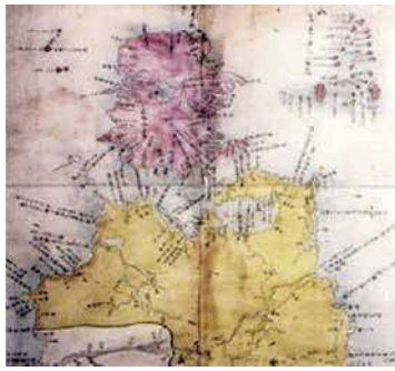
江戸幕府撰 正保日本図 (1644年)

1604年(慶長9年)、江戸幕府は松前藩に蝦夷地での交易権を認めました。松前藩は、北方領土や千島列島に住むアイヌの人々とも交流を始めました。