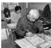
版画受講生の皆さん

老壮大学の良いところは、どの指導者の方もきちんと教えてくれることです。版画教室では年賀状の絵を版画で作成できるのが人気ですね。好きなことをみんなでできるのは楽しいです。皆さんも参加してみませんか？