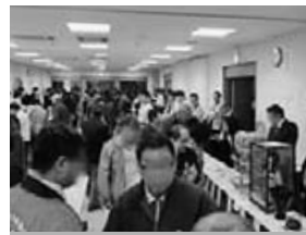
昨年の公売会の様子