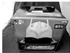
キャラクターグッズ