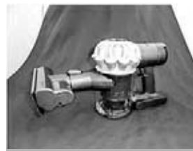
ハンディー掃除機