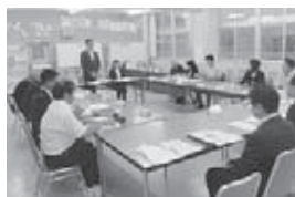
統合協議会で新しい学校づくりについて協議しました