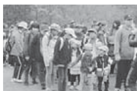
合同遠足で交流しました