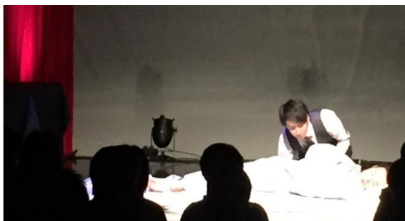
★オープニングセレモニー(納棺の儀) 美しい見事な手さばきで、厳かに儀式を行いました。映画「おくりびと」を指導した方の息子さんに、うっとり!