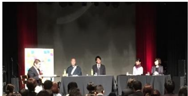
★パネルディスカッション「あなたにとって死ぬって??」 4者それぞれの「看取り」「その方の尊厳」の考えが語られました