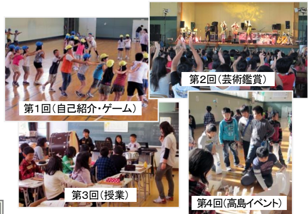
第1回(自己紹介・ゲーム)

児童交流は、第1回目が8月29日に行われ、9月4日、10月30日、11月22日とこれまで4回、祝津小児童が高島小を訪れ、楽しい時間を過ごしました。