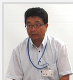
仲倉会長 (花園小校長)