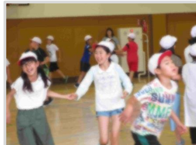
5年生(7月18日) たすけおに