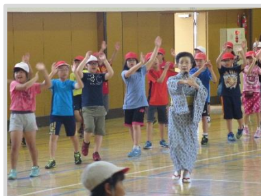
3・4年生(7月19日) 踊りの練習