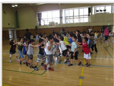
1・2年生(7月20日) じゃんけん列車

7月18日～20日の3日間、両校の児童が花園小学校体育館に集まり、「潮音頭」・「潮踊り唄」の踊りの練習や体育的レクリエーションを楽しみながら交流しました。