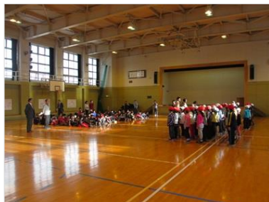
前半は稲穂小2年生72名との交 流。合唱、ゲームで楽しみました