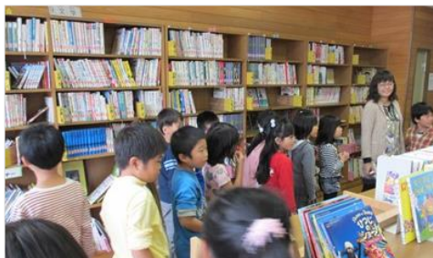
「本の貸出しはバーコードを読み取ります」 教頭先生の説明にびっくり(図書室)