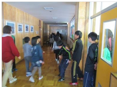
「こんにちは!」稲穂小5年生が 廊下で優しく声を掛ける場面も