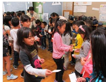
ローマ字で書いた名刺を使って 自己紹介(3年生教室)