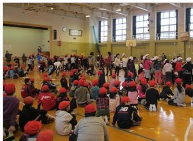
後半は全校児童が紅白に分かれ ての玉入れ。盛り上がりました