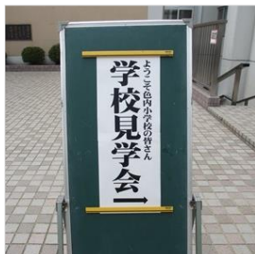
ようこそ! 色内小の皆さん