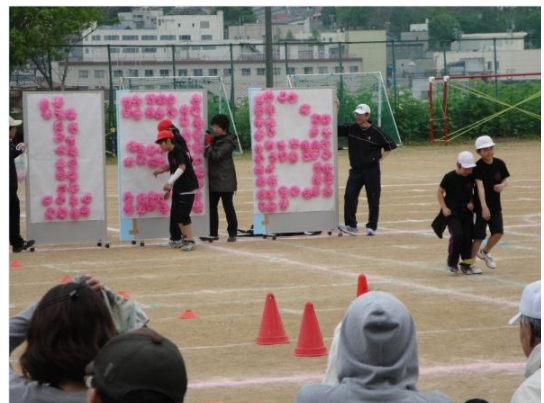
花いっぱいにな〜れ！ 「138周年記念」