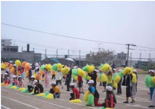
ヘビーローテーション 「1、2、3、ハイ」