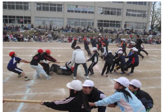
ありの棒引き 「う〜ん」「それ引けえ〜！」