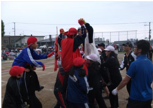
騎馬戦 「おっしゃ〜」「がんばれ〜！」