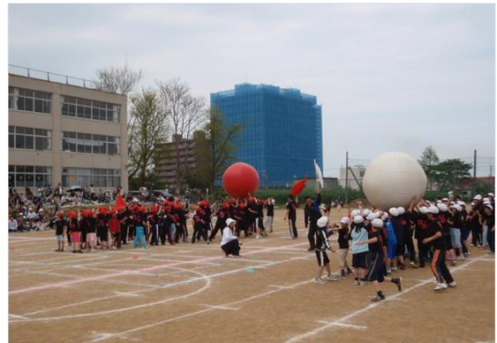
大玉送り 「いけ〜」「玉押せ〜！」