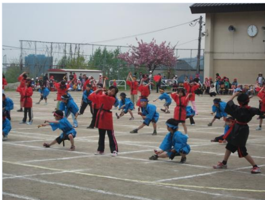
HANAZONO ソーラン 「それ、それ、それ〜」