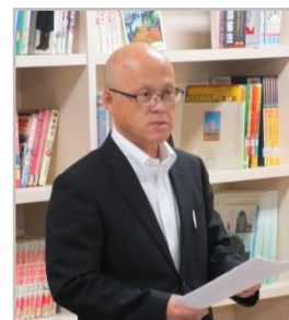
天山部会長 (天神小教頭)

また、統合校のPTA組織については、3校の保護者や教職員で組織や会則等を立案し内容等を協議会に報告する旨説明がありました。