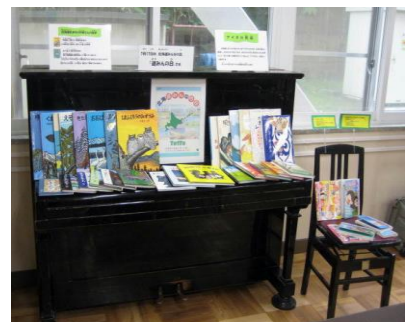
子どもたちの本への興味を高める季節に合わせた図書の展示

※キャリア教育 ～ 「一人一人の社会的・職業的自立に向け、必要な基盤となる能力や態度を育てることを通して、キャリア発達を促す教育」