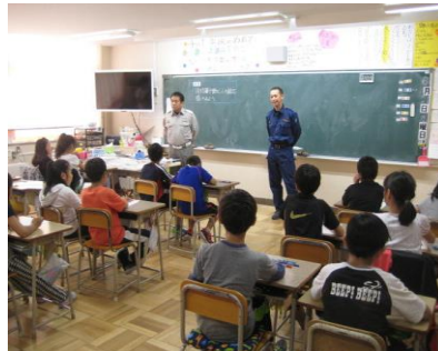
消防職員による出前授業

校区内には多くの工場や商店などがあるため、出前授業や職場見学、職業体験といった地域や環境を生かした体験活動を進めるとともに、子どもたちに労働観や職業観を身に付けさせるなど、生き方教育の基本となる「キャリア教育」に取り組みます。