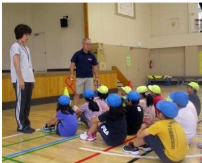
体育専科教員を活用したチーム・ティーチングによる体育授業

体育専科教員を活用し、学級担任とのチーム・ティーチングによる体育授業の充実や子どもの体力向上に取り組み、全ての教育活動の基盤として、たくましいからだ、最後までやり抜く心を持つ子どもの育成を目指します。