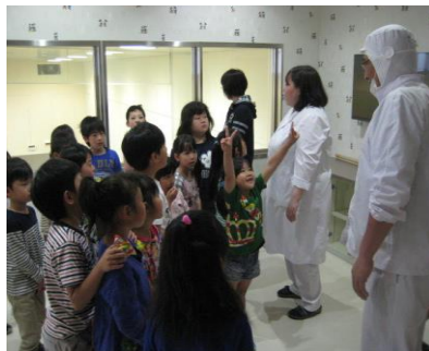
給食センターの見学