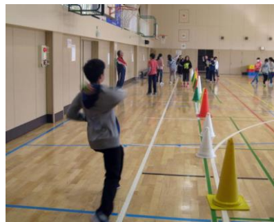
的当てチャレンジで体力づくり