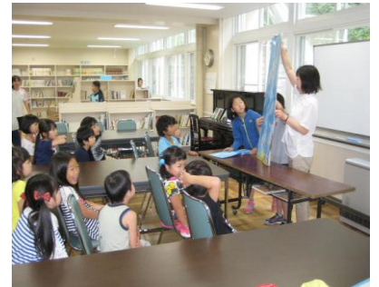
児童会文化図書委員会による読み聞かせ

朝読書や読み聞かせなどにより読書習慣を育成するほか、図書館司書の活用や市立図書館などと連携し図書館環境の整備と読書活動の充実に取り組みます。