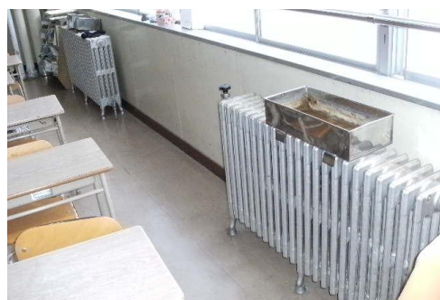
暖房機(個別 FF ストープ集中制御方式へ更新)