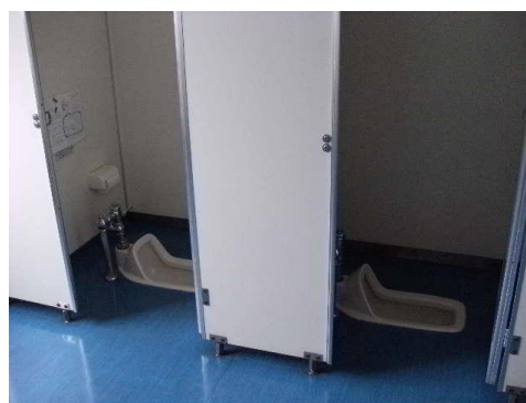
トイレ(洋式化・悪臭対策)