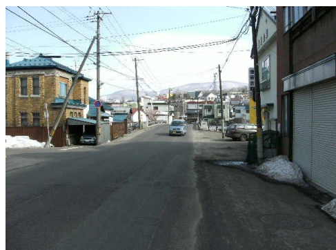
東通線(歩道設置 住吉郵便局→真栄橋)