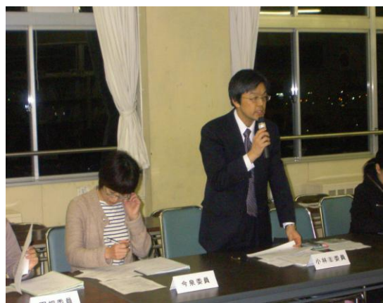
「教職員部会」からの報告