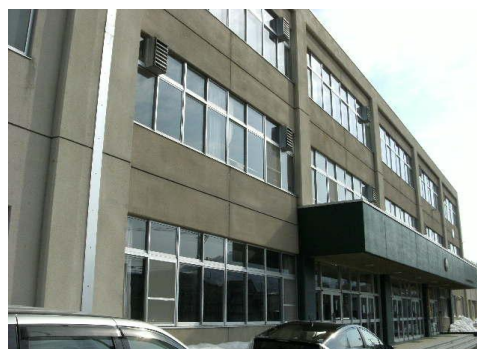
校舎(外壁改修・塗装など)