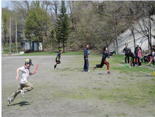
《交流ゲーム》3校対抗リレー(5、6年生)