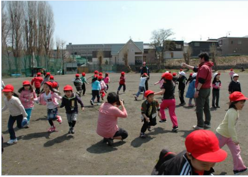
《交流ゲーム》3校合同「鬼ごっこ」 (1、2年生)

・低学年(1、2年生) 入船公園 ・中学年(3、4年生) 色内埠頭公園 ・高学年(5、6年生) 朝里川公園