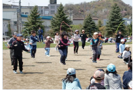
《交流ゲーム》3校合同「リズムなわとび」 (3、4年生)