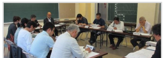
第1回校名・校歌・校章に関する部会