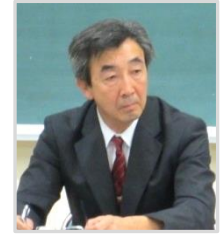
松本部部长 (末広中学校長)

松本部部长から統合校の校名案の応募結果と部会での選考経過について説明があり、統合校グランドデザイン（案）や応募理由などを参考にしながら、部会における一次選考として「北小樽」、「北陵」、「凌北」の三つの校名候補を選考した旨報告がありました。部会報告を受けて協議した結果、部会で選考した三つの校名候補を教育委員会に報告することに決定しました。