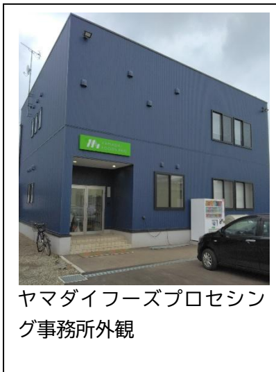
ヤマダイフーズプロセッシング事務所外観

求人情報を見てご連絡をさせていただき、会社説明と工場見学に伺いました。同社は納豆の製造工場として、スーパーでよく見かける納豆や、コンビニやディスカウントストアのプライベートブランドの商品などの製造をされています。