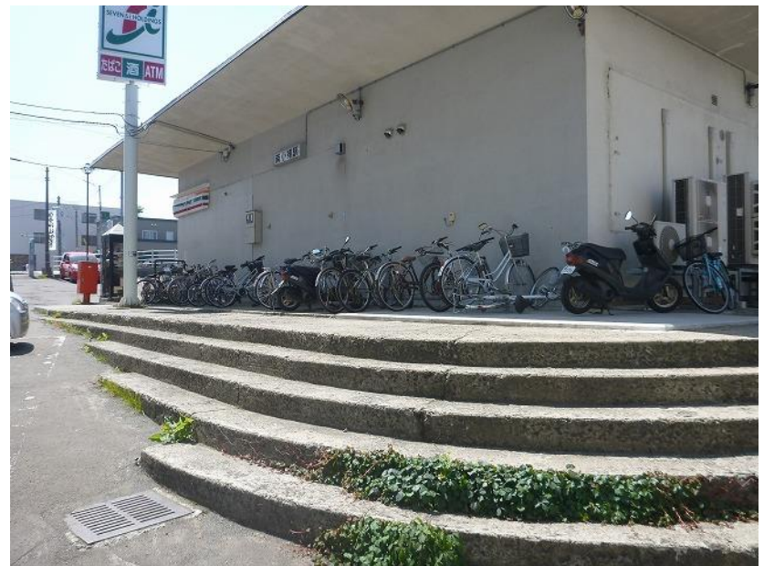
< JR南小樽駅の様子 >