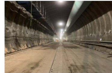
ニツ森トンネル(尾根内) トンネル掘削作業状況