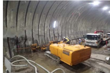
ニセコトンネル 器材坑施工状況