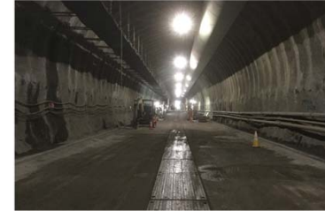
ニツ森トンネル(尾根内)