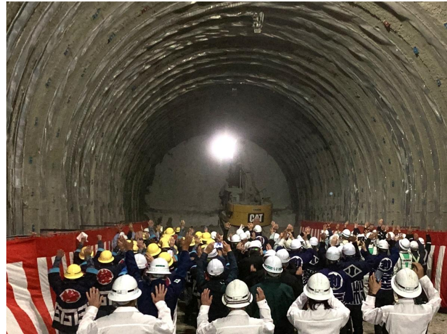
掘削完了地点の状況