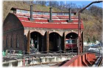
炭鉄港（旧手宮鉄道施設）