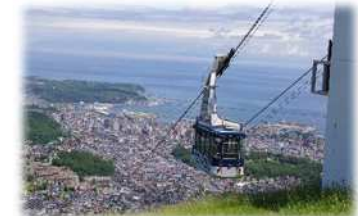
天狗山からの眺望