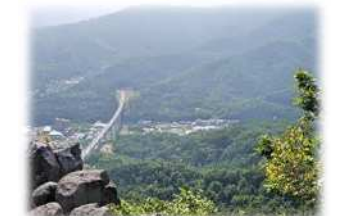
（新駅予定地を望む）