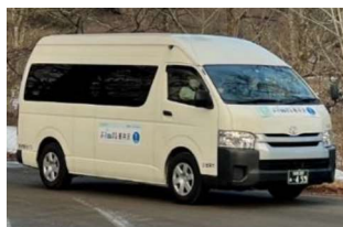
運行車両（通常タイプ）イメージ