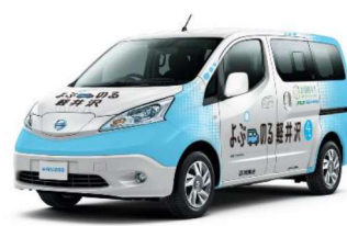
運行車両（電気自動車）イメージ