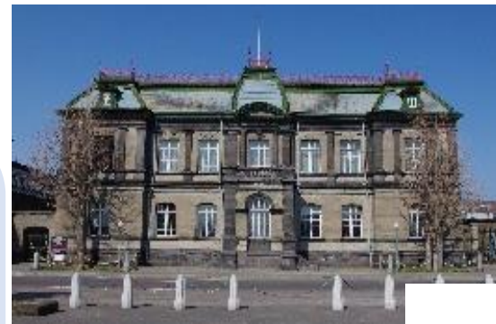
重要文化財 旧日本郵船(株)小樽支店

小樽市は道内でも歴史的建造物が多く存在しているまちです。 市有施設でも歴史的建造物があり、その改修・保存工事などにも携わることができます。