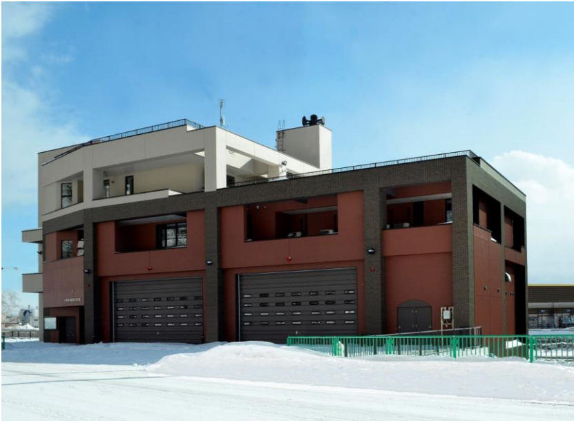
事例1) 消防署手宮支署新築工事

竣工 : R3.2月 工事概要 : 消防署の新築 建物構造 : 鉄筋コンクリート造 地上3階