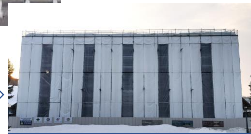
改修工事中 (R5年3月現在)