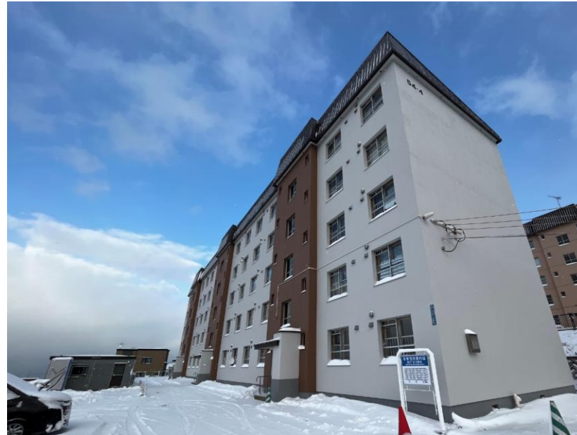
事例2) 市営住宅外壁等改修工事 (桜東住宅54-4号棟) 〈改修後〉

竣工 : R4.12月 工事概要 : 市営住宅の外壁及び屋根の改修 建物構造 : 鉄筋コンクリート造 地上5階