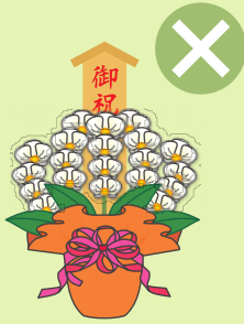
落成式・開店祝などの祝花、 葬儀の供花、病気見舞いなど