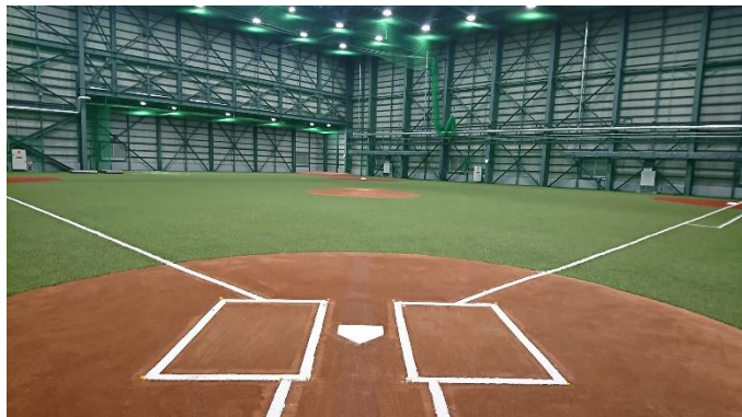
北海道ガス野球部室内練習場ネット新設

体育用器具及び遊器具の製作・取付・メンテナンスを行っています。設計から溶接・曲げなどの機械加工、塗装まで自社にて対応します。サッカーゴールやラグビーゴールのほか、野球バッティングゲージやネットを製作しています。公園内の遊具や体育館内の各種体育器具など、施設の大きさに合わせてオリジナルで製作します。素材も、鉄・アルミ・ステンレスなどの対応が可能です。また、コンビネーション遊具や木製遊具（アスレチック）などの魅力ある、かつ安全性を重視した製品も提供しています。