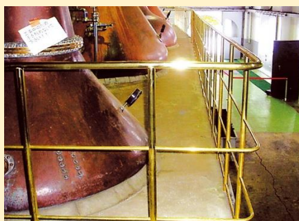
ニッカウキスキー醸造塔真鍮手すり製作