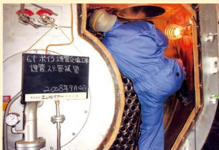
ボイラーチューブ取替工事