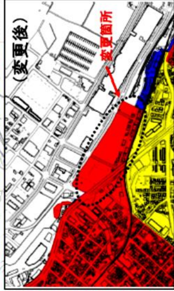
朝里川温泉地区周辺拡大図