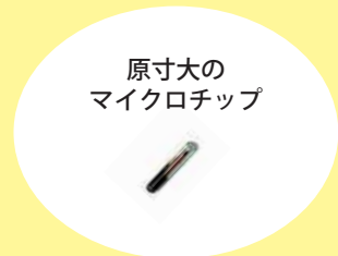
原寸大の マイクロチップ

令和4年6月1日に「改正動物愛護管理法」が施行され、販売される犬や猫へのマイクロチップの装着・登録が義務付けられます。犬や猫を家族に迎え入れた飼い主は自分の住所や氏名、電話番号を変更登録する必要があります。