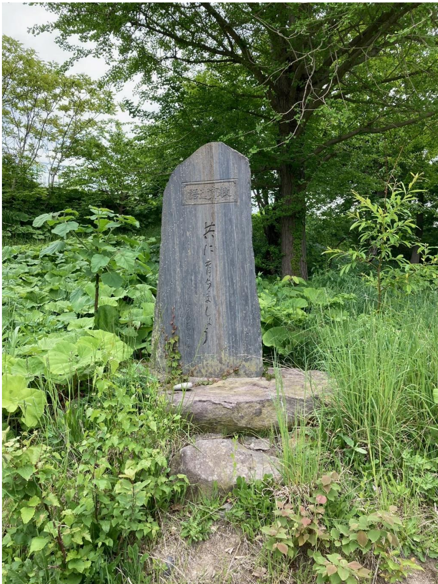
共に育ちましょう