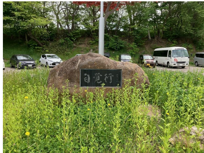
自覚行(じかくぎょう)