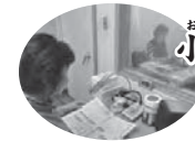
おたるろうどくともかい 小樽朗読友の会 社会福祉の向上に貢献

昭和47年の設立以来、長年にわたり図書の点訳を通じて視覚障害がある方の情報取得支援ならびにコミュニケーション支援に取り組んでこられ、その活動を通じ、本市の社会福祉の向上に寄与されました。