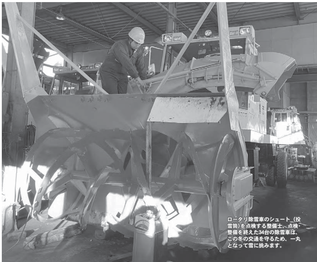
ロータリ除雪車のシュート(投雪筒)を点検する整備士。点検整備を終えた34台の除雪車は、この冬の交通を守るため、一丸となって雪に挑みます。

①とどろく 海のかなたに 空そめて 朝陽かがやく 潮のせる風 希望をはこぶ 港のゆくて 光がはしる おお われら われら小樽市民 ②はげしく もゆる生命に ふりあおげ 父祖の山なみ このおおいなる 歩みにきざそう 夢みらないな ほこりにみちて おお われら われら小樽市民 ③あふれる 熱の息吹きに うた若く 町をかなでる 人かぎりなく 心をあわせ 世界を拓く 未来を拓く おお われら われら小樽市民