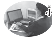
おたるてんやくともかい 小樽点訳友の会 社会福祉の向上に貢献

昭和45年の設立以来、長年にわたり手話の普及ならびにろうあ者に対する正しい理解の啓発に取り組んでこられ、その活動を通じ、本市の社会福祉の向上に寄与されました。