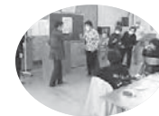
おたるしゅわかい 小樽手話の会 社会福祉の向上に貢献

長年にわたり小樽市医師会の役職を歴任され、救急医療の推進や看護人材の育成に尽力し、地域医療の充実や保健福祉の向上に寄与されました。