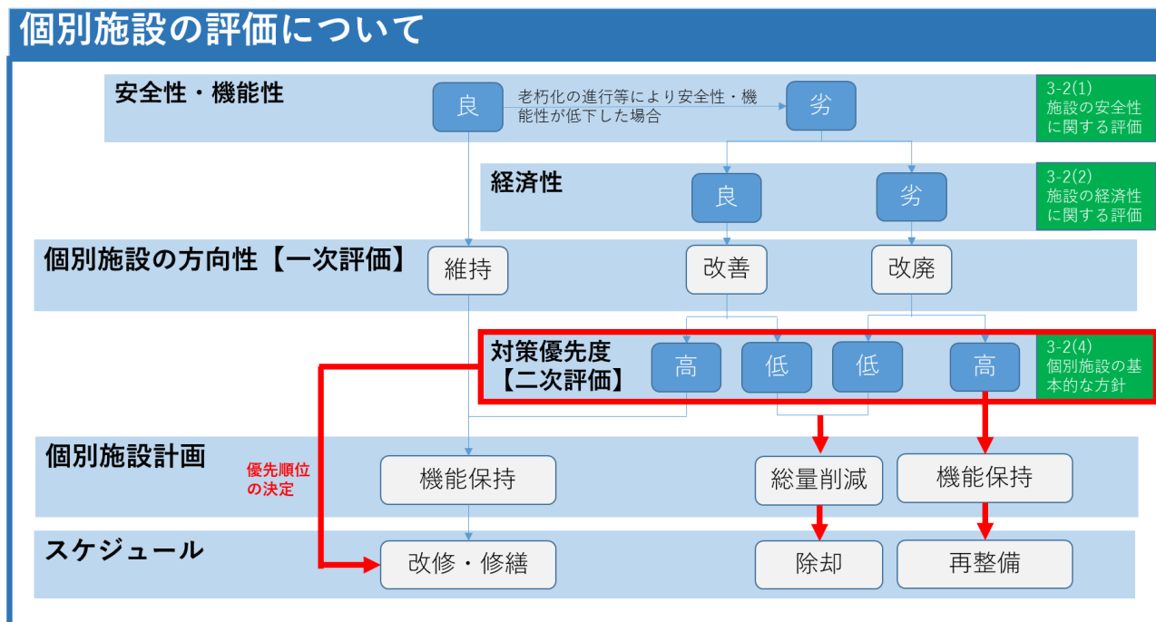
【個別施設の評価フロー図】

最後に、対策の優先順位は「再整備」⇒「除却」⇒「改修・修繕」とし、改めて対策優先度の評価を行うことにより、「再整備」「除却」「改修・修繕」の区分ごとに対策の優先順位を決定します。