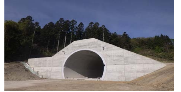
16.立岩トンネル(ルコツ) 防水工打設状況