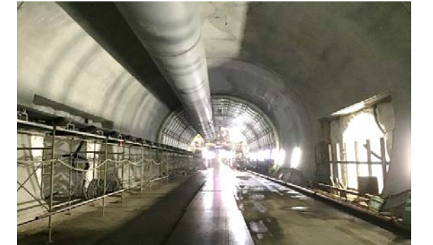
28.ニツ森トンネル(鹿子)他 覆工完了状況