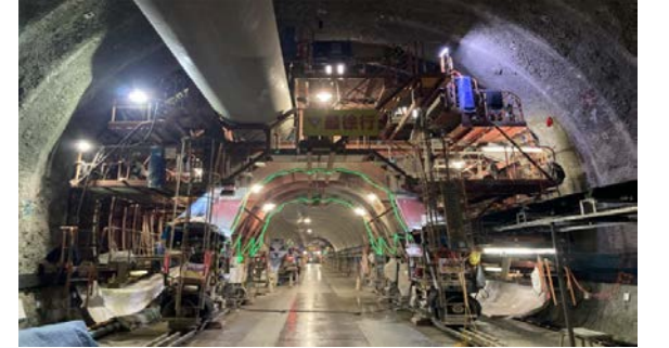
22.内浦トンネル(幌内)他 坑内状況