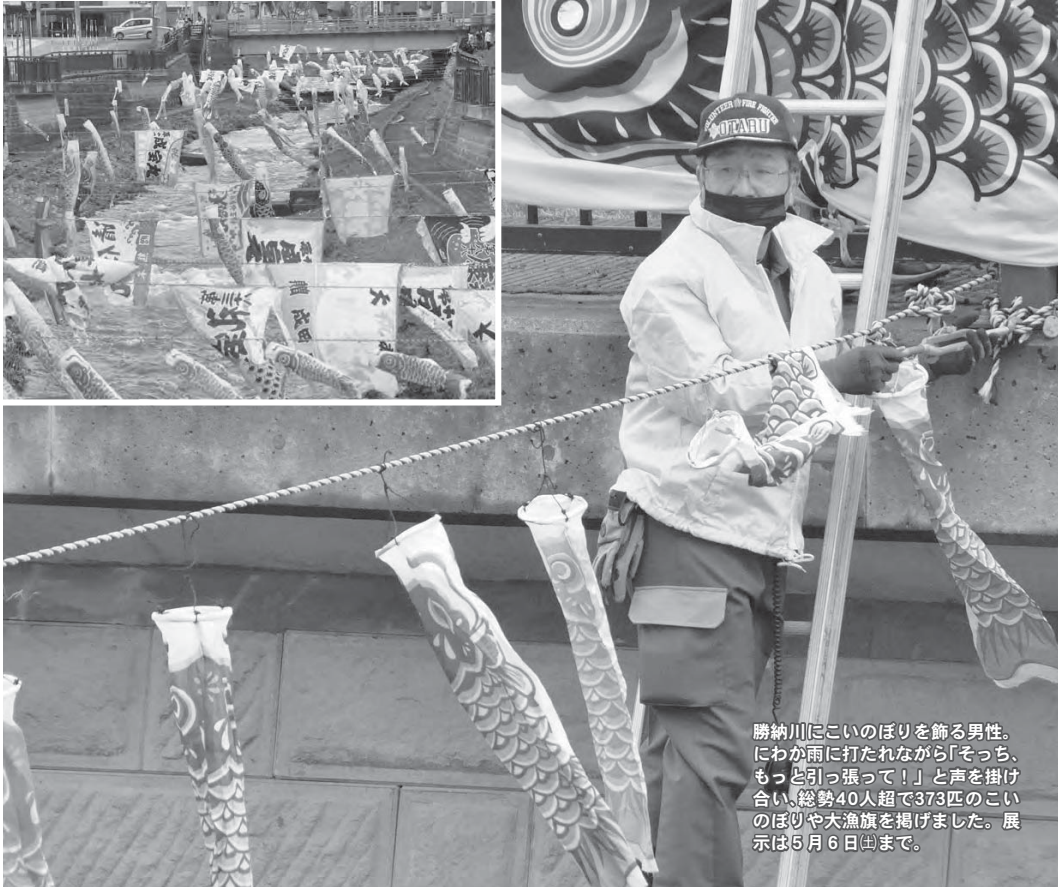
勝納川にこいのぼりを飾る男性。にわか雨に打たれながら「そっち、もっと引っ張って!」と声を掛け合い、総勢40人超で373匹のこいのぼりや大漁旗を掲げました。展示は5月6日(土)まで。