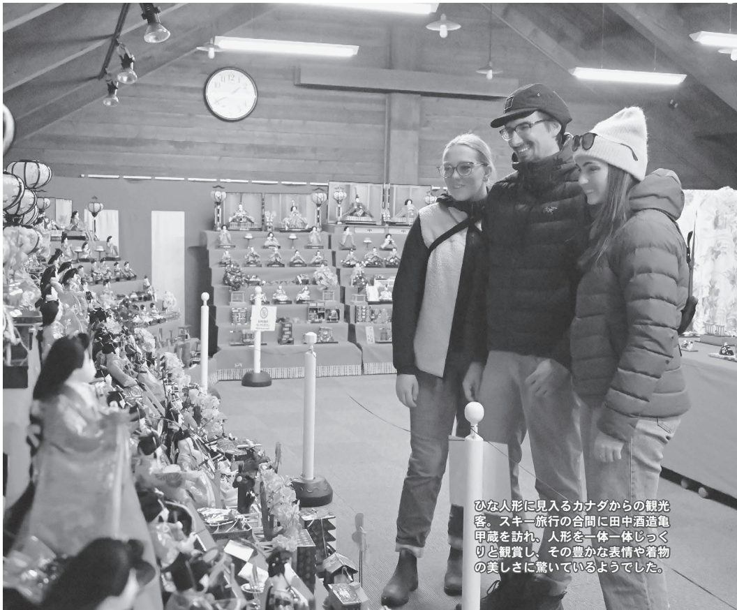
ひな人形に見入るカナダからの観光客。スキー旅行の合間に田中酒造亀甲蔵を訪れ、人形を一体一体じっくりと観賞し、その豊かな表情や着物の美しさに驚いているようでした。