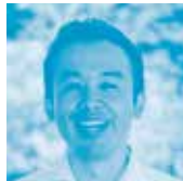
北海道職業能力開発大学校 電子情報技術科 職業訓練指導員 工学修士

IT教育の専門家がAI時代を迎えて変化する子どもの教育についてわかりやすく解説。実際に小学校で行われている授業内容だけでなく、これからの学びについても実践的内容でお伝えいたします。