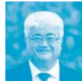
北海道職業能力開発大学校 生産電子情報システム技術科 職業能力開発教授 工学修士