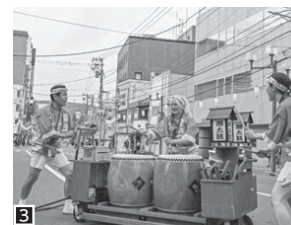
3 おたる潮太鼓保存会が潮ねりこみやメイン会場のステージで祭りを盛り上げます。4 神輿パレードでは、道内外から多くの担ぎ手が小樽に集結。威勢のいい掛け声の中、神輿がうねる姿は圧巻です。5 大花火大会では、約5000発の花火が打ち上がります。