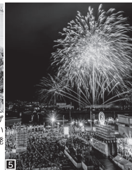
5 大花火大会では、約5000発の花火が打ち上がります。*花火の打ち上げに伴い、色内埠頭公園周辺の立ち入りを規制します。