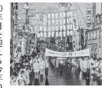
▲昭和42年に開催した第1回おたる潮まつり

60年目の「潮まつり」 夏の訪れとともに、小樽のまちが活気づく季節がやってきました。今年も「おたる潮まつり」を7月24日、26日の3日間で開催します。おたる潮まつりは、市民が一体となって海への感謝と小樽の発展を祈念し、まちに活気をもたらすための祭りとして始まりました。