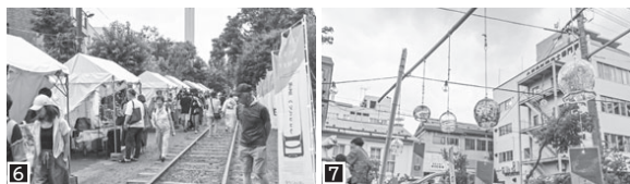
6 小樽がらす市の会場では、多彩なガラス作品の販売や製作体験、子ども向けクイズラリーを実施するほか、グラスデザインコンテストの入賞作品も展示。7 風鈴の音が涼を運ぶ「風鈴トンネル」は例年人気の撮影スポット！

安全に海水浴を楽しむためには、海の特徴を理解した上で、正式に開設された海水浴場を利用しましょう。海水浴場内では、必ず監視員がいる区域で泳ぎ、それぞれの場所で定められたルールを守ることが大切です。安全に気を配りながら、楽しい夏をお過ごしください。