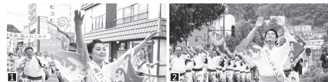
1 朝ふれこみは、潮コンシェルジュ(小樽コンシェルジュ)や踊り社中などが市内の中心部をふれ回り、祭りの始まりを告げます。2 潮ねりこみは、市内の団体などが梯向を作って、市内中心部を踊り歩きます。当日、沿道から飛び入りで参加できる「とびいりD.E 踊り隊」もあります。

60年目の「潮まつり」 夏の訪れとともに、小樽のまちが活気づく季節がやってきました。今年も「おたる潮まつり」を7月24日、26日の3日間で開催します。おたる潮まつりは、市民が一体となって海への感謝と小樽の発展を祈念し、まちに活気をもたらすための祭りとして始まりました。