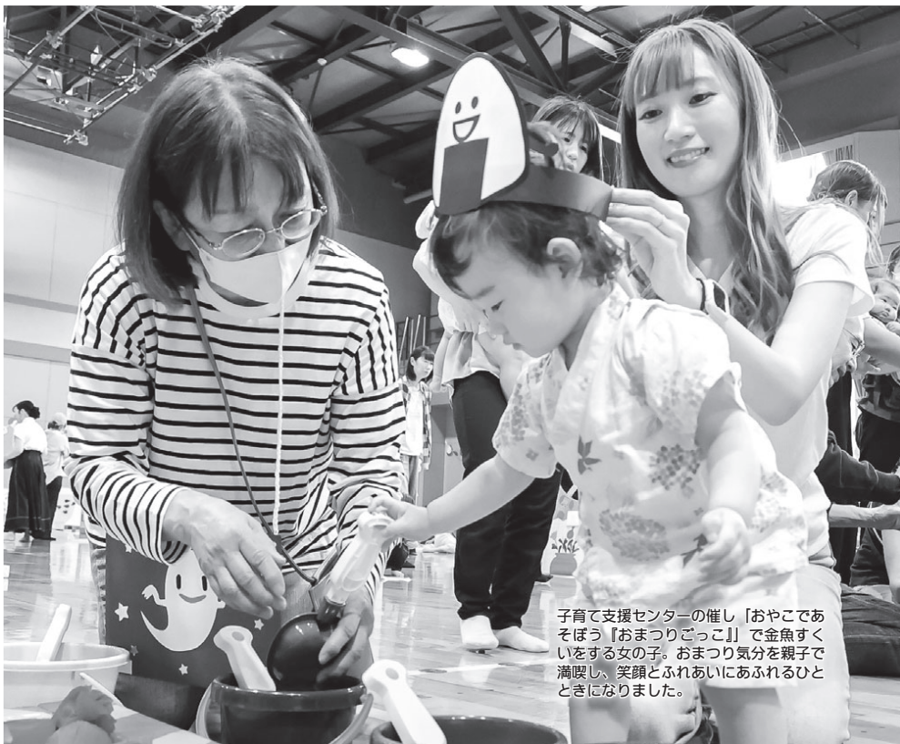
子育て支援センターの催し「おやこでおそぼう『おまつりごっこ』」で金魚すくいをする女の子。おまつり気分を親子で満喫し、笑顔とふれあいにあふれるひとときになりました。