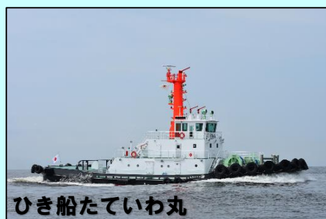
ひき船たていわ丸