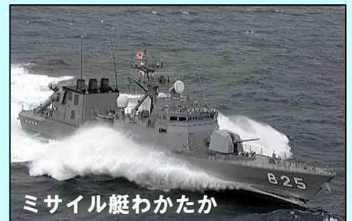
ミサイル艇わかたか