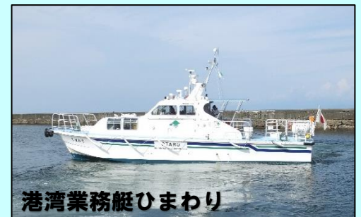
港湾業務艇ひまわり