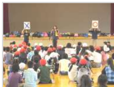
お互いの学校を知ろう～〇×ゲーム (色内小・稲穂小)