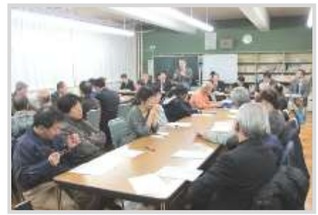
奥沢小・天神小合同懇談会 (奥沢小 図書室)

▶市長部局においても、これまでの統合で通学路の歩道整備を行うなど、学校再編について協力いただいています。今後とも連携して取り組んでいきます。