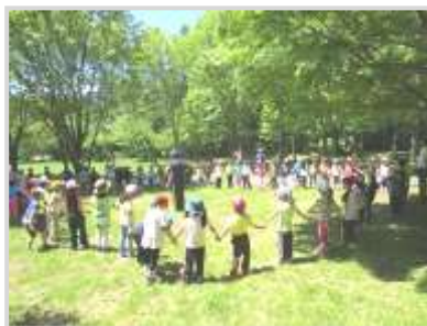
長橋なえぼ公園へ合同遠足 (長橋小・色内小 1年生)