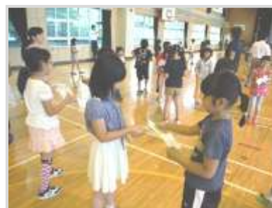
手宮小体育館に4校が集まって交流 (北手宮小・手宮西小・手宮小・色内小 2年生)