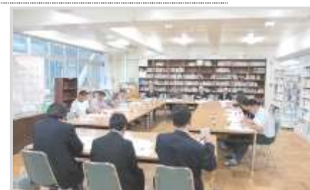
第2回学校支援部会 (長橋中 図書室)

平成27年6月9日 第4回学校づくり部会 平成27年6月25日 第2回学校支援部会