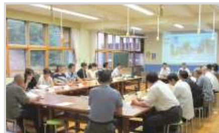
第4回学校づくり部会 (手宮西小 図工室)

平成27年3月26日 第3回学校づくり部会 平成27年5月26日 第6回校名・校歌・校章に関する部会 平成27年6月4日 第2回学校支援部会 平成27年7月23日 第4回学校づくり部会