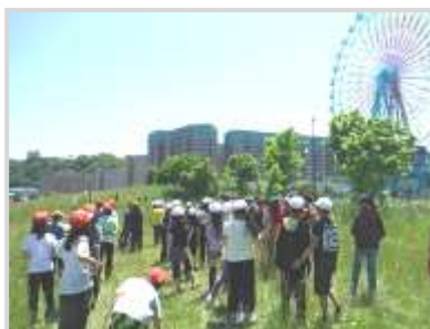
築港臨海公園での交流 (長橋小・色内小 5年生)