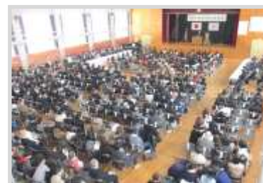
閉校式の様子 (若竹小 平成25年2月撮影)