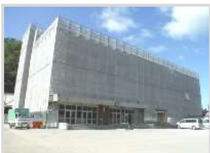
工事中の奥沢小（8月下旬撮影）

今年度、校舎と体育館の耐震補強工事を実施しています。耐震補強と合わせて、外壁や屋上、教室内部や照明の改修のほか、暖房設備の更新、トイレの洋式化等の工事も行っています。