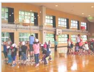
玉入れて盛り上がりました (北手宮小・手宮西小・手宮小・色内小 5年生)