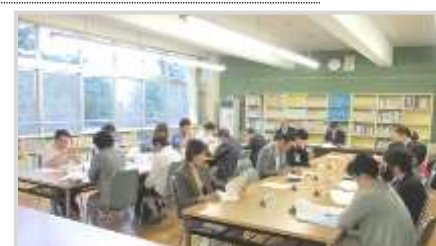
第3回統合協議会 (末広中 図書室)

平成27年6月11日 第2回学校づくり部会 平成27年6月18日 第1回校名・校歌・校章に関する部会 平成27年7月15日 第3回統合協議会