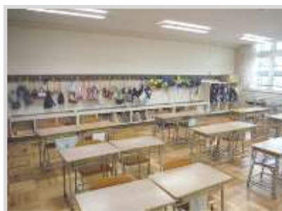
収納スペースが増えた教室