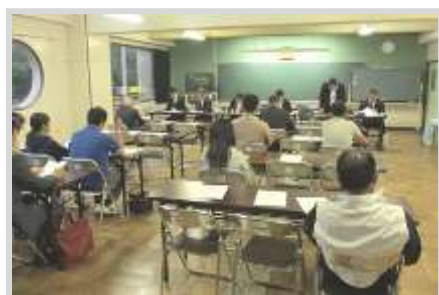
入船小での懇談会