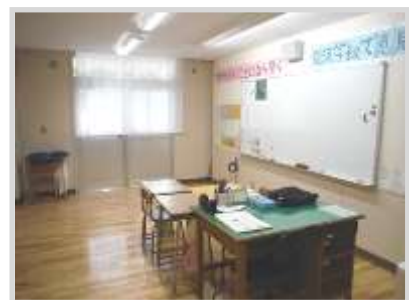
可動間仕切りを採用（特別支援学級）