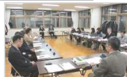
第3回統合協議会 (稲穂小 クラブハウス)