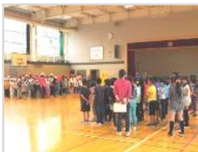
色内小体育館での交流 (色内小・稲穂小)