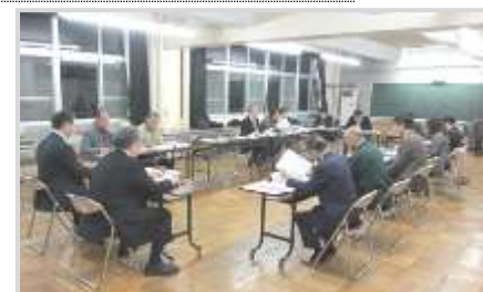
第3回統合協議会 (長橋小 第2図工室)

平成27年3月2日 第3回学校づくり部会 平成27年3月24日 第3回統合協議会 平成27年7月8日 第4回学校づくり部会 平成27年7月14日 第3回学校支援部会