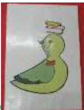
いちばんじょうず「一番上手で賞」

その後は、職員手づくりのたるばとちゃんとたるびよちゃんの福笑い。目をぎゅーっとなつぶったら、「これは目だよ！」「本だよ！」声をかけながらパーツを渡していきます。とってもたのしいお正月になりました！