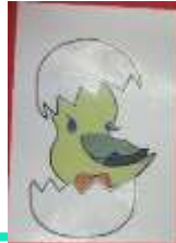
いちばんおもしろ「一番面白いで賞」